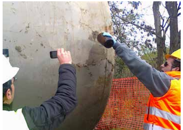
Controlli d'integrità Serbatoi con Spessimetro, Thickness Test e Adhesion Test