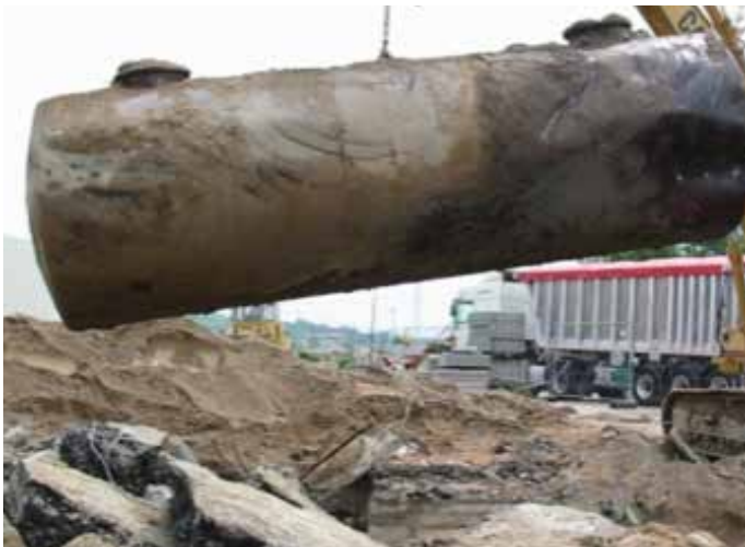
Rimozione serbatoi con procedure che ne consentono il mantenimento di integrità

Una importante case history ha riguardato il progetto di ammodernamento della Rete Carburanti Esso nel Sud Italia, in particolare gli impianti i cui serbatoi, vecchi, erano "monoparete".